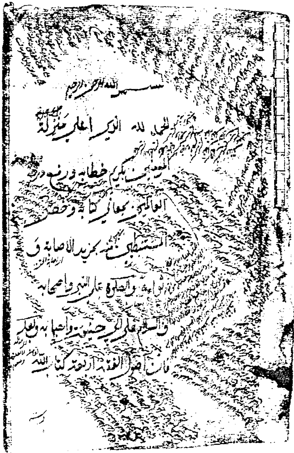
الورقة الأولى من مخطوطة خزانة المخطوطات لمعهد البيروني للدراسات الشرقية في طشقند المرقمة بـ ٦٦٣٨، والتي لم أظفر بنسخة لها